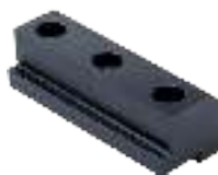
Ersatzbacken Jaws Mors d'échange