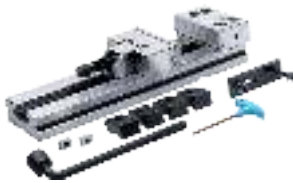
Maschinen-Schraubstöcke mechanisch Machine vices mechanical Étaux mécaniques de haute