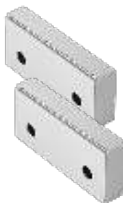
Krallenbacken (Paar) Claw jaws (Pair) Mors à griffes (Paire)