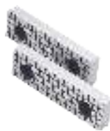
Geriffelte Backen (Paar) Serrated jaws (Pair) Mors à rainures (Paire)