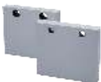
Ersatzbacken Jaws Mors d'échange