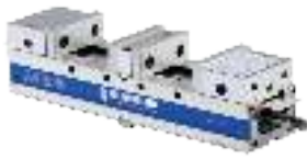
Doppelspannstöcke mechanisch Twin vices mechanical Étaux mécaniques à double serrage