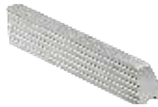
Ersatzbacken Jaws Mors d'échange