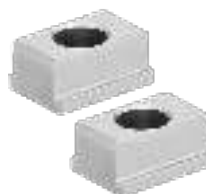
Zentrier-Nutensteine (Paar) Centering nut (Pair) Coulisseaux à centrer pour étau (Paire)