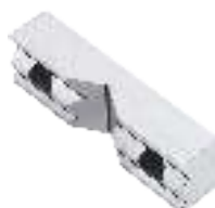
Prismenbacken (1 Stück) Prismatic jaws (1 piece) Mors prismatiques (1 pièce)