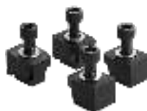
Spannpratzensatz 4-teilig Clamping sets 4-parts Set de sabots de serrage 4 pieces