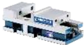
Maschinen-Schraubstöcke mechanisch Machine vices mechanical Étaux mécaniques à haute pression