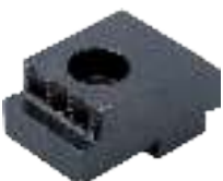
Ersatzbacken Jaws Mors d'échange