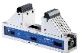
5-Achs Maschinen-Schraubstöcke 5-Axis-Machine vices Étaux à 5-axes