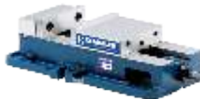
Maschinen-Schraubstöcke mechanisch Machine vices mechanical Étaux mécaniques à haute pression