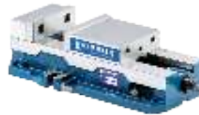
Maschinen-Schraubstöcke mechanisch Machine vices mechanical Étaux mécaniques à haute pression