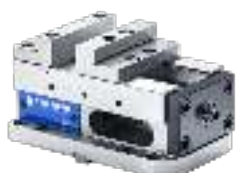
5-Achs Maschinen-Schraubstöcke 5-Axis-Machine vices Étaux à 5-axes