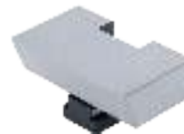
Niederzugbacken Hold down jaws Mors d'emboutissage