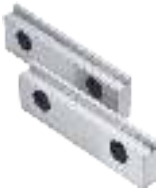
Stufenbacken (Paar) Step jaws (Pair) Mors étagés (Paire)