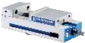
Maschinen-Schraubstöcke mechanisch Machine vices mechanical Étaux mécaniques à haute pression