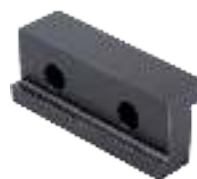
Ersatzbacken Jaws Mors d'échange