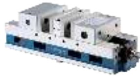
Doppelspannstöcke mechanisch Twin vices mechanical Étaux mécaniques à double serrage