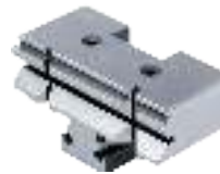
Prismenbacken Prismatic jaws Mors prismatiques