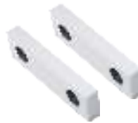
Ersatzbacken (Paar) Spare jaws (Pair) Mors d'échange (Paire)