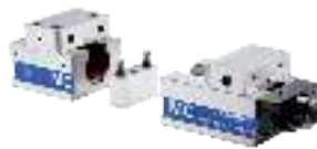
Mehrfachspannsystem 3-teilig Multiple Clamping System 3-parts Système multiple de serrage 3-pièces