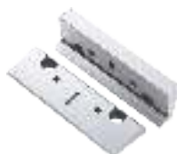
Niederzugbacken (Paar) Hold down jaws (Pair) Mors d'emboutissage (Paire)